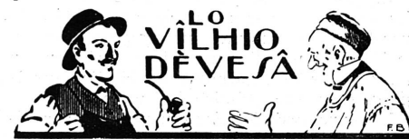
A L'ÉCOULA ET U CATSIMO

Cet incident ne contribua guère à la rapidité du voyage ; aussi, quand nos magistrats arrivèrent au château de Prangins, l'oiseau n'était plus au nid !