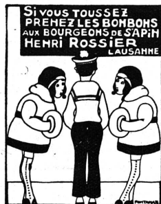
Rossier frères, succ.

VILLENEUVE BÉCHERT-MONNET & Cie LAUSANNE