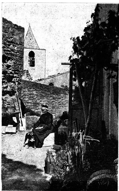
LES BAUX — Un coin du Vieux Village.

— Ces tonnerres de Méridionaux, il n'y en a point comme eux. C'est bien le cas de dire : « Poison de souleil ! ».