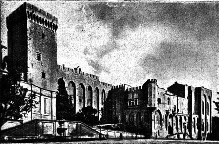
Château des Papes.

— La visite dure environ deux heures, déclare le chauffeur. Quand vous aurez parcouru toutes les salles, vous monterez au sommet de la Tour des Trouillas !