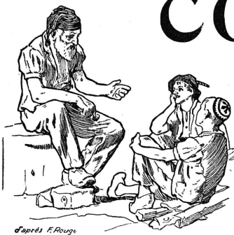
d'après F. Roug

JOURNAL DE LA SUISSE ROMANDE PARAISSANT LE SAMEDI