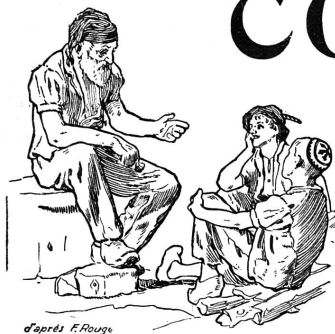
d'après F. Rouge

Rédaction et Administration : Imprimerie PACHE-VARIDEL & BRON , Lausanne Pré-du-Marché, 7