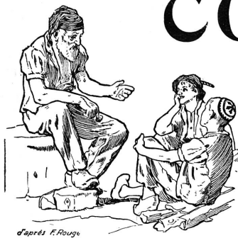
d'après F. Rouge

Rédaction et Administration : Imprimerie PACHE-VARIDEL & BRÛN , Lausanne Pré-du-Marché, 7