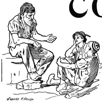
d'après F. Rouge