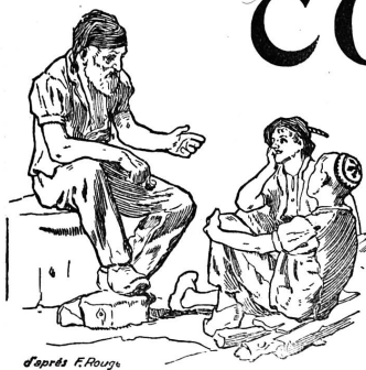
d'après F. Roux

Rédaction et Administration : Imprimerie PACHE-VARIDEL & BRON , Lausanne Pré-du-Marché, 7