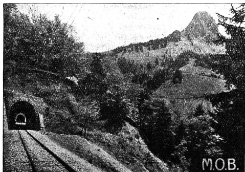
Le tunnel et la Dent de Jaman

Chemin de fer électrique Montreux-Oberland bernois