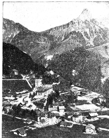
Les Avants et la Dent de Jaman

Chemin de fer électrique Montreux-Oberland bernois