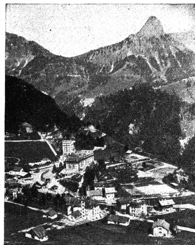
Chemin de fer électrique Mntreux-Oberland bernois. - Les Avants et la dent de Jaman.