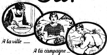
A la ville —