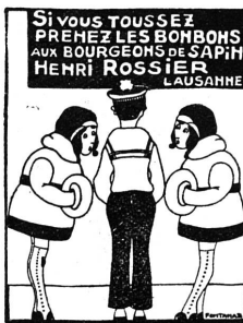
Henri ROSSIER et ses Fils successeurs

Elaboration de plans de réclame. Répartition et contrôle de budgets par voie de journaux, affichage, imprimés, etc.