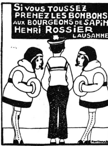
Henri ROSSIER et ses Fils successeurs

Elaboration de plans de réclame. Répartition et contrôle de budgets par voie de journaux, affichage, imprimés, etc.