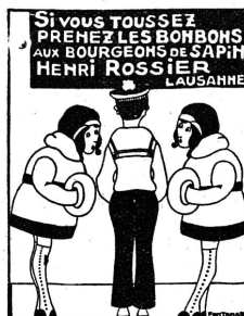
Henri ROSSIER et ses Fils successeurs

Ces meubles sont devenus indis- pensables pour serrer livres, pa- piers (de famille), titres, etc. Le public très souvent se voit dans la triste nécessité de sacrifier ces ob- jets en cas d'incendie. Il s'empres- sera de s'éviter tout souci en de- mandant un prospectus à François TAUXE, fabricant de Coffres-forts, à Malley, LAUSANNE.