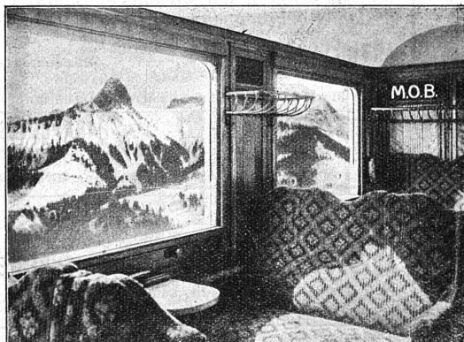
Voiture salon de la Cie Montreux-Oberland bernois.

FÆTISCH FRÈRES S. A. Lausanne, Rue de Bourg