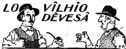
ONCLLIO ET NÉVAO