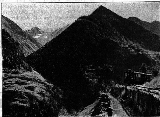
Près de Finhaut.