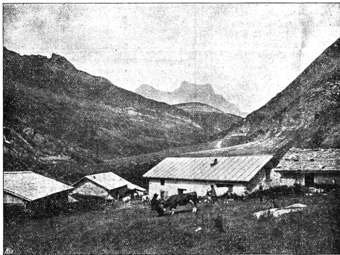
Les chalets de La Varraz.