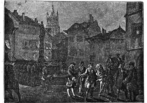
L'arrestation de Davel à Lausanne

carna le personnage du martyr vaudois. Les deux fois le succès fut très grand. Il ne le sera certainement pas moins cette fois-ci, d'autant, nous l'avons dit, que la pièce sera montée avec un grand luxe et admirablement interprétée par les Muséens.