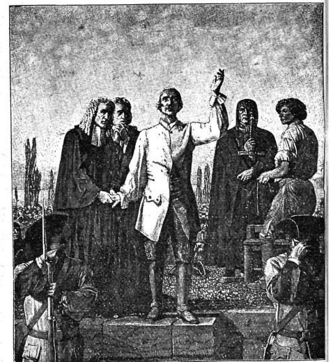
L'exécution du Major Davel à Vidy, près de Lausanne d'après le tableau du peintre Ch. Gleyre.

Au commencement du XVIII e siècle, la veste était presque aussi longue que le justaucorps. En 1812, elle devient le gilet.