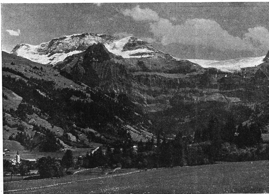
Lenk et Wildstrubel.