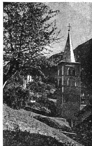
L'Eglise de Finhaut.