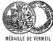
MÉDAILLE DE VERMEIL