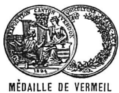
MÉDAILLE DE VERMEIL