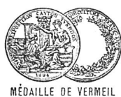
MÉDAILLE DE VERMEIL