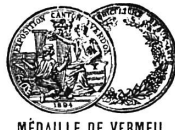
MÉDAILLE DE VERMEIL