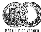
MÉDAILLE DE VERMEIL