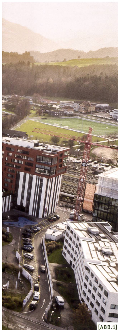
[ABB.1] Blick in das Quartier «Suurstoffi» in Rotkreuz als Vorzeigüberbauung, deren bessere Integration in die Gemeinde eine Aufgabe in der räumlichen Strategie ist /

Weiter auffallend ist der geringe Einbezug der Bevölkerung in der Vergangenheit. Die unterschiedlichen Möglichkeiten