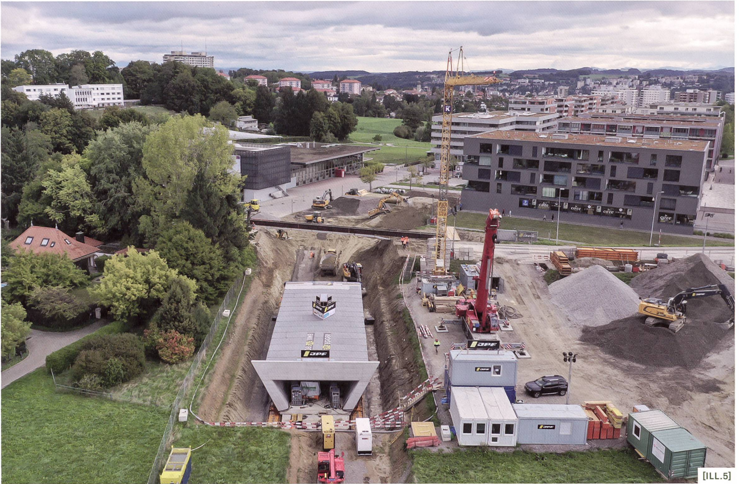
[ILL.5] Passage inférieur en construction sous la route cantonale à Villars-sur-Glâne, ouvrage de 1500 tonnes / Bau der Unterführung an der Kantonsstrasse in Villars-sur-Glâne, ein 1500 Tonnen schweres Bauwerk / Sottopasso in costruzione sotto la strada cantonale a Villars-sur-Glâne, un'opera di 1500 tonnellate