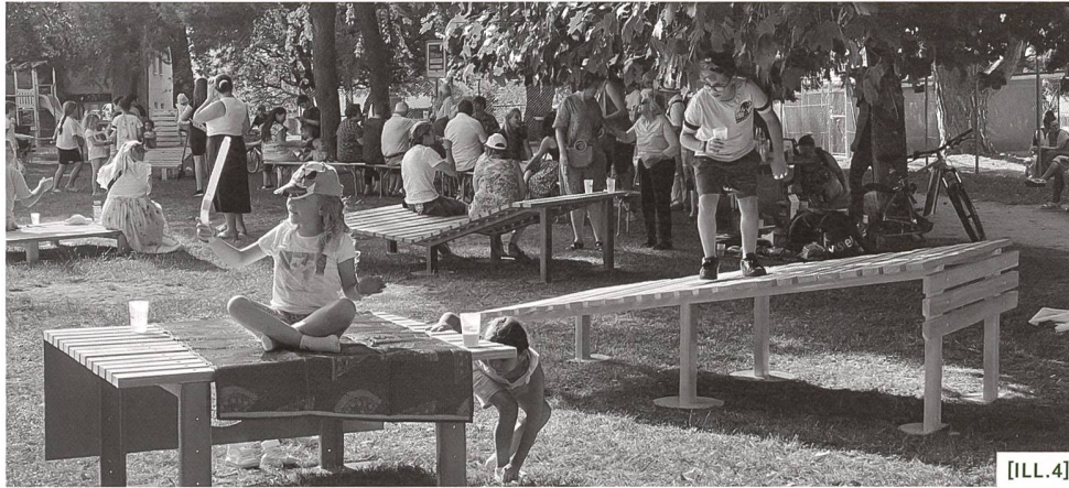
[ILL.4] Aménagements participatifs du Parc d'Epenex / Partizipativ gestalteter Parc d'Epenex / Mobilia urbana partecipativa del Parc d'Epenex

Dans ce but, et soucieuse d'être à l'écoute de sa population, la Ville saisit maintenant régulièrement l'occasion de mener des démarches participatives pour comprendre ce qu'elle attend de son territoire. Une démarche de contrat de quartier à Epenex a, par exemple, permis de recréer les conditions d'un dialogue entre la population, les autorités et l'administration, en vue de la création commune d'équipements et de l'aménagement d'un parc public [ILL.4]. Dans le futur quartier En Mapraz, le projet d'un parc public, issu d'un partenariat public-privé, a également fait l'objet d'une démarche ouverte