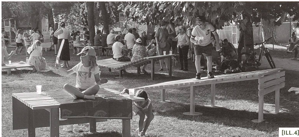
[ILL.4] Aménagements participatifs du Parc d'Epenex / Partizipativ gestalteter Parc d'Epenex / Mobilia urbana partecipativa del Parc d'Epenex

Dans ce but, et soucieuse d'être à l'écoute de sa population, la Ville saisit maintenant régulièrement l'occasion de mener des démarches participatives pour comprendre ce qu'elle attend de son territoire. Une démarche de contrat de quartier à Epenex a, par exemple, permis de recréer les conditions d'un dialogue entre la population, les autorités et l'administration, en vue de la création commune d'équipements et de l'aménagement d'un parc public [ILL.4]. Dans le futur quartier En Mapraz, le projet d'un parc public, issu d'un partenariat public-privé, a également fait l'objet d'une démarche ouverte