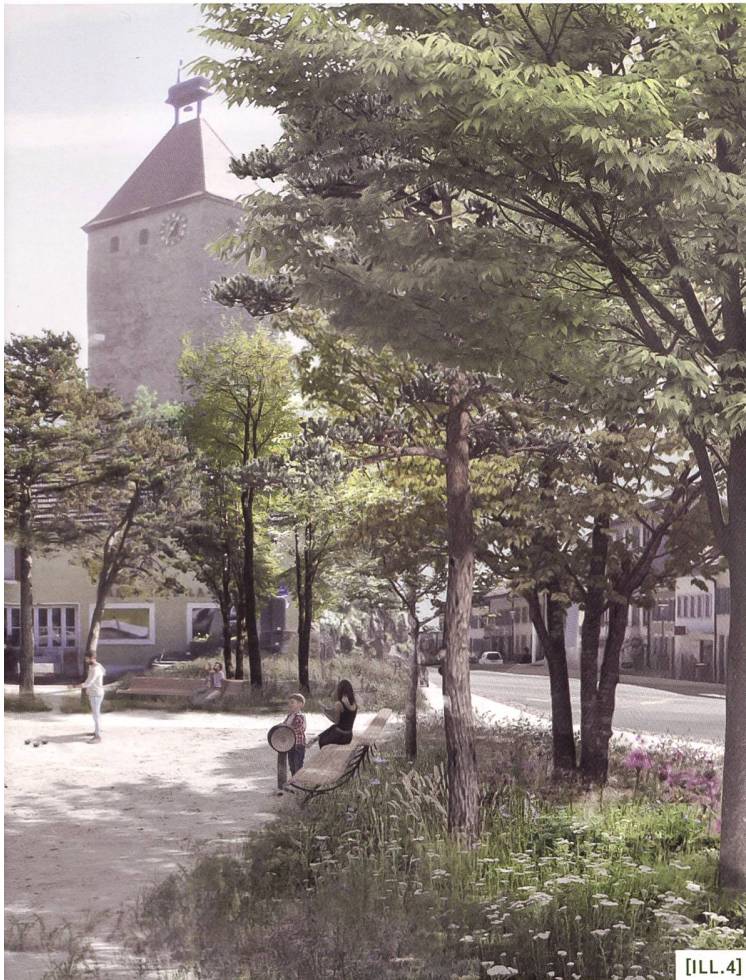
[ILL.4] Vue du projet lauréat des MEP «La Tour de Trême centre»/ Ansicht des Siegerprojekts des Studienauftrags «La Tour de Trême centre»/ Vista del progetto vincitore dei mandati di studio parallelo «La Tour de Trême centre»