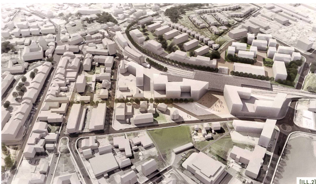
[ILL.2] Vue du projet lauréat des MEP « Plateau de la gare », Group8 et RGR / Ansicht des Siegerprojekts des Studienauftrags « Plateau de la gare », Group8 et RGR / Vista della vincita vincitore dei mandati di studio parallelo « Plateau de la gare », Group8 et RGR

Le projet lauréat du bureau Brauen Waelchli Architectes, associé à Jean-Jacques Borgeaud, architecte-paysagiste, restructure le site et relie les différents aménagements par un axe rectiligne dédié à la mobilité douce (de 915 m de long) qui délimite le bâti à l'ouest et un espace vide à l'est, articulant ainsi clairières et forêt. Ce tracé à l'échelle territoriale permet non seulement de façonner un grand espace à vocation sportive avec une grande économie de moyens (préservant une part importante des infrastructures existantes) mais aussi d'accorder une unité au site. Il fait ainsi émerger la notion de « parc urbain », encore peu planifiée et vécue dans cette ville en croissance. [ILL. 3]