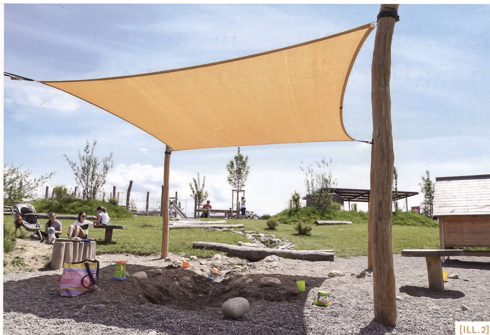
[ILL. 2] Parc du Maggenberg à Fribourg : aménagement d'un espace ouvert convivial réalisé dans le cadre du projet «Fribourg (ou)vert». / Maggenbergpark in Freiburg: Gestaltung eines gemeinschaftlichen Freiraums im Rahmen des Projekts «Grünraum Freiburg». / Parco del Maggenberg a Friburgo: intervento per creare uno spazio accogliente nell'ambito del progetto «Fribourg (ou)vert».