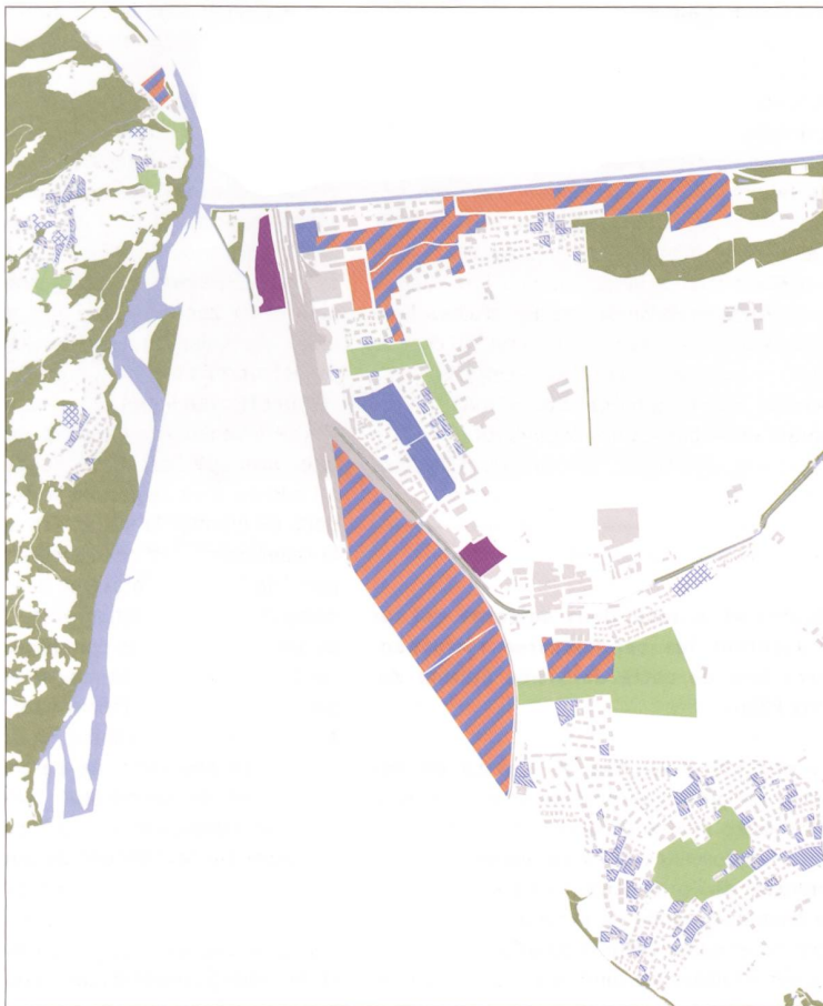
[ABB.2] Etappierung Leitszenario Innenentwicklungsstrategie