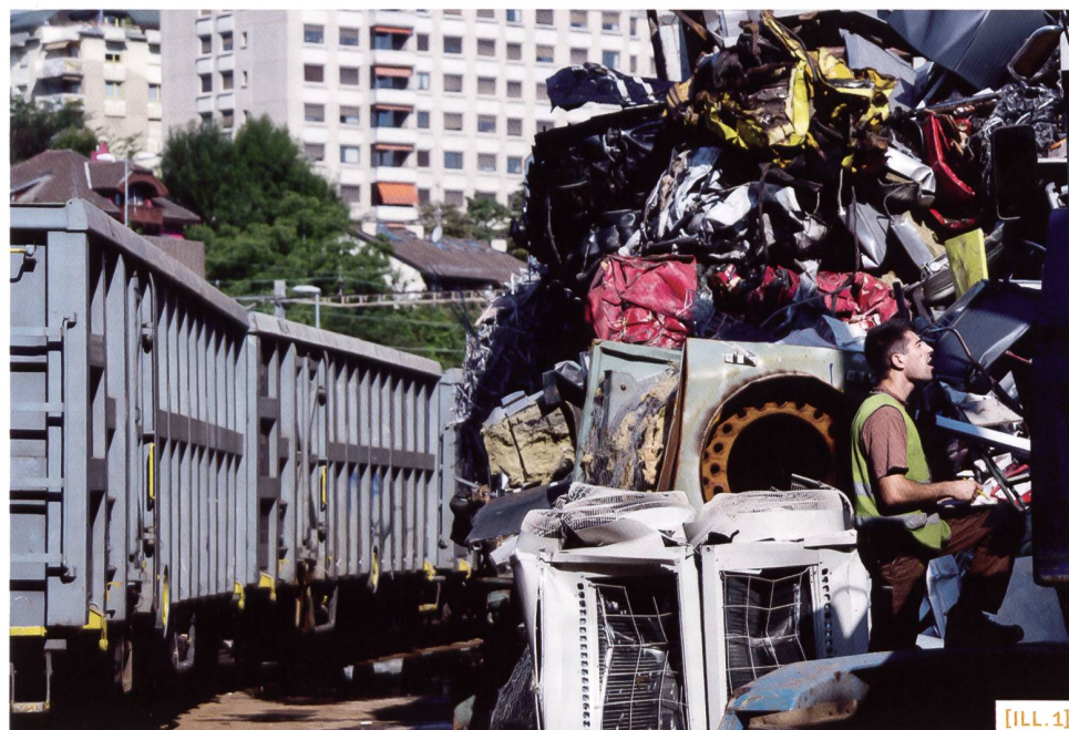
[ILL. 1] ZIPA recyclage de métaux, par le rail, en zone urbaine / ZIPA, riciclaggio di metalli con la ferrovia in ambiente urbano / ZIPA Recycling von Metallen über die Schiene, in städtischem Umfeld