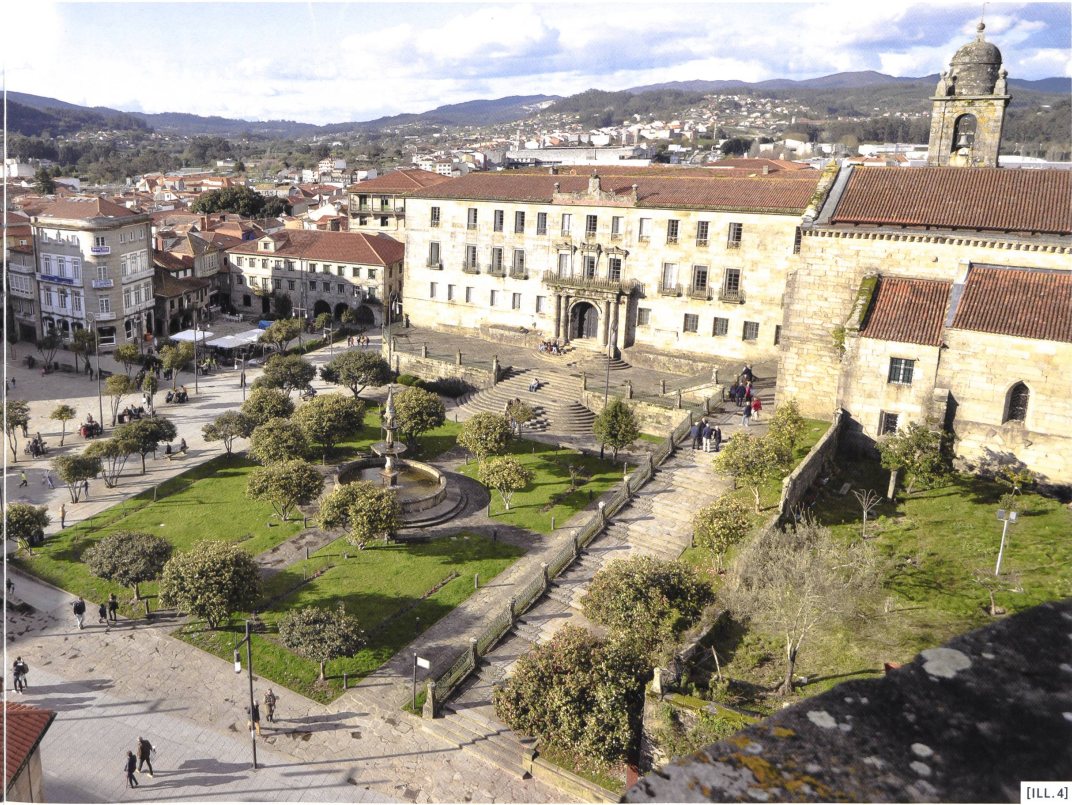
[ILL. 4] Vue aérienne de la Place Ferreria sans voitures. (Consello de Pontevedra)

Pour occuper les espaces laissés vides par les voitures, nous avons essayé de dynamiser la vitalité économique, de faciliter l'ouverture de nouveaux établissements avec des terrasses ou encore les livraisons... de créer en définitive un grand centre commercial urbain, à l'opposé des grandes surfaces périphériques.