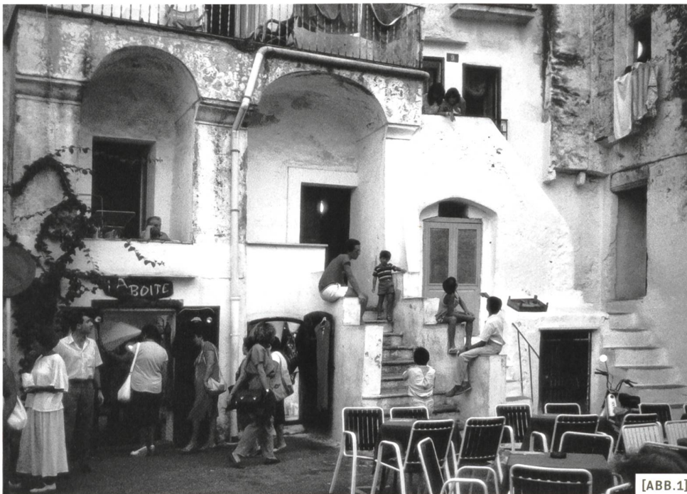
[ABB.1] Schwellen, Passagen, Membranen sind charakteristische Räume der porösen Stadt, Sperlonga 1985.