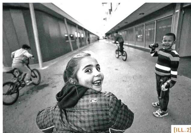
[ILL. 1+2] Quartier des Libellules, Vernier (GE).