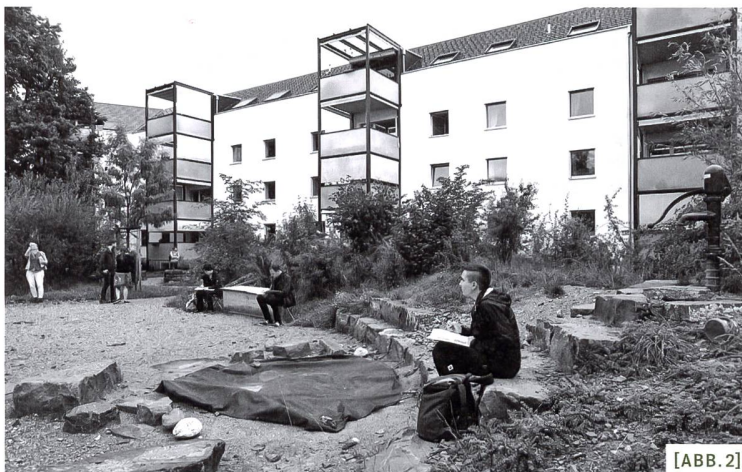
[ABB. 2] In der Fröschmatt wurde die Umgebungsgestaltung partizipativ mit den Anwohnenden unter Berücksichtigung von Biodiversität erarbeitet.