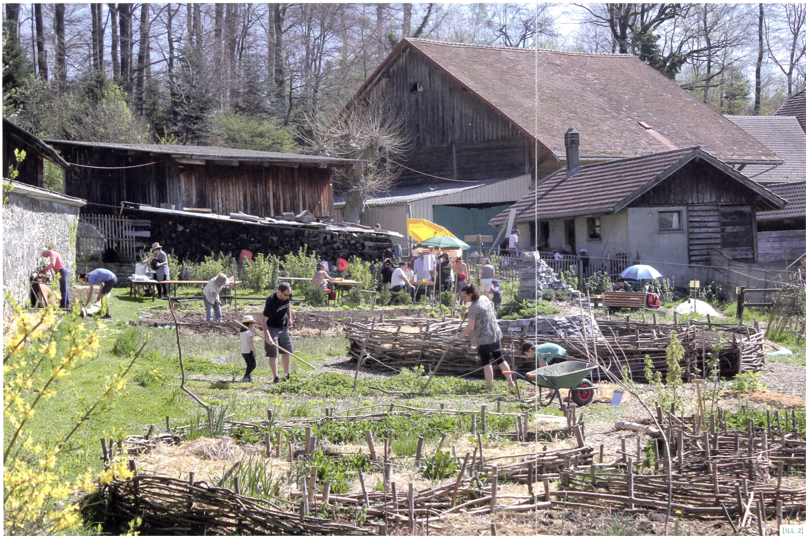
[ILL. 2] Un chantier participatif ouvert au public à la ferme agroécologique de Rovéréaz.

Dans les espaces publics urbains, parcs, places ou même trottoirs, on peut venir superposer une production alimentaire aux autres fonctions. Mais ces espaces ont déjà beaucoup de fonctions. Et lorsqu'on rajoute de l'agriculture, cela peut leur porter préjudice. Il y a une telle multitude d'éléments à prendre en compte dans l'aménagement d'un espace public. En ville, on a aussi des espaces privés, typiquement les pieds d'immeubles, qui représentent un grand potentiel. A l'heure actuelle, ils sont monofonctionnels et sous-utilisés. Ils peuvent être partagés entre les différents habitants et en y ajoutant une fonction de production alimentaire, ils peuvent devenir des lieux de rencontre, de réinsertion sociale, de recyclage de déchets, etc. D'ailleurs dans les nouveaux projets de quartier, cela devient un standard.