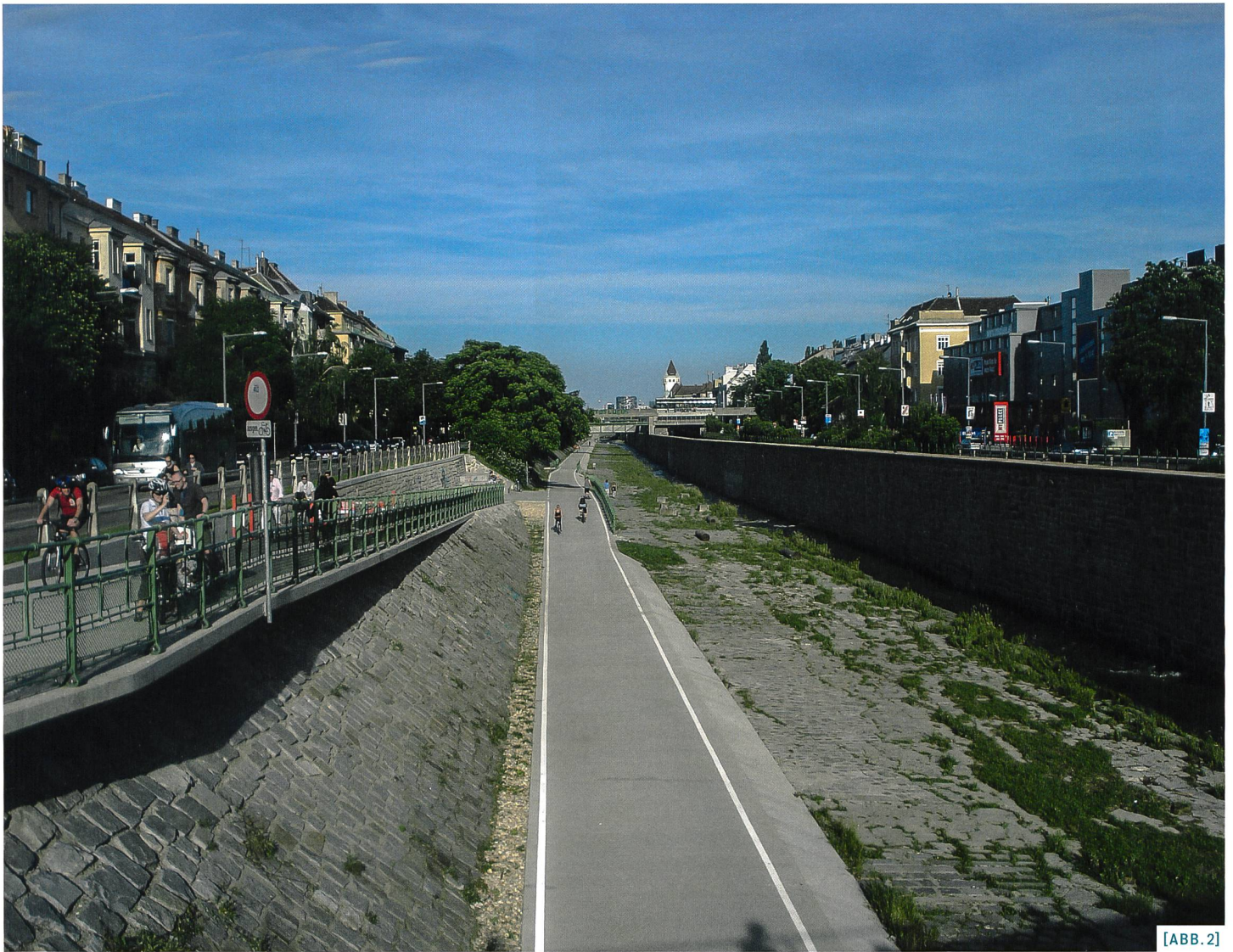
[ABB. 2] Veloschnellroute in Wien.

Trotz der bestehenden Herausforderungen und trotz des anerkannten Potenzials ist zum Thema Veloschnellrouten bisher wenig Forschung betrieben worden. Es gibt lediglich verschiedene praxisbezogenen Überlegungen (Machbarkeitsstudien und Empfehlungen), jedoch keine wissenschaftlich basierten Forschungsergebnisse. Deshalb erforscht KONTEXTPLAN AG (Federführung) zusammen mit Christian Wiesmann (Experte Städtebau) und Fritz Kobi (Experte Verkehr) derzeit im Auftrag der SVI und des ASTRA die optimalen Einsatz- und Gestaltungsmöglichkeiten für solche Veloschnellrouten in Schweizer Städten und Agglomerationen. In der Forschungsarbeit sollen die Erwartungen auf die konkreten räumlichen und rechtlichen Bedingungen in der Schweiz heruntergebrochen werden. Die Arbeit wird Antworten darauf geben, wie Veloschnellrouten baulich, rechtlich und planerisch – insbesondere mit Blick auf die Integration in städtische Räume – zufriedenstellend ausgeführt werden können. Dazu gehören die Definition von Projektierungselementen (Geschwindigkeiten, Sichtweiten, Querschnittsbreiten, Kurvenradien, Gestaltung von Knoten, usw.) ebenso wie Vortrittsregelungen, Anpassung von Lichtsignalanlagen und die Einpassung in den Strassenraum (Markierung, Signalisation, Wegweisung, Ausrüstung, usw.).