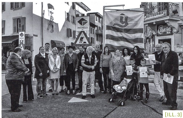
[ILL. 3] Septembre 2014, des commerçants s'opposent à la suppression de trois places de parc en mettant en berne le drapeau de la ville. Un an auparavant, ils avaient déjà déposé une pétition munie de 3200 signatures contre d'éventuelles suppressions de places de parc à la rue de la Plaine et à la rue du Valentin.

Dans cette ambiance, d'autres projets pourraient prendre une nouvelle orientation. Pour le parking de la place d'Armes, les discussions autour de son dimensionnement pourraient pencher vers 800 places de parc, comme le demandait le parti libéral-radical dans la presse, en opposition à la Municipalité d'alors qui optait pour un statu quo, soit les 563 places actuelles. Pour la suite du quartier Gare-Lac, les plans de quartiers pourraient tendre vers les maxima des fourchettes pour le stationnement, dans l'esprit des revendications du même bord lors du passage du PDL devant le législatif. Et les éventuelles suppressions de place de parc, qu'elles soient en lien avec le plan de stationnement ou la mise en place des zones 30, pourraient suivre la voie des citoyens et commerçants se plaignant de ces pertes [ILL.3]. Tous les scénarios sont possibles.