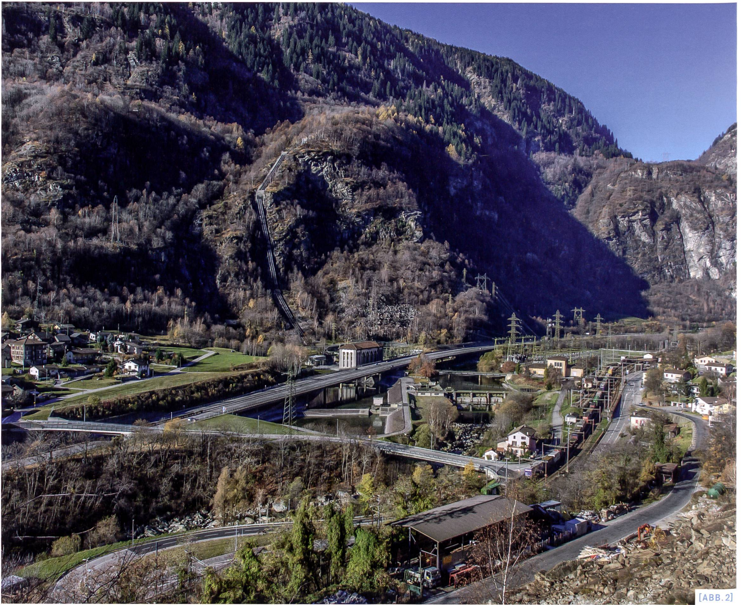
[ABB. 2] Dichtes Infrastruktur- Nutzungsgefüge auf beengten inneralpiner Talböden.