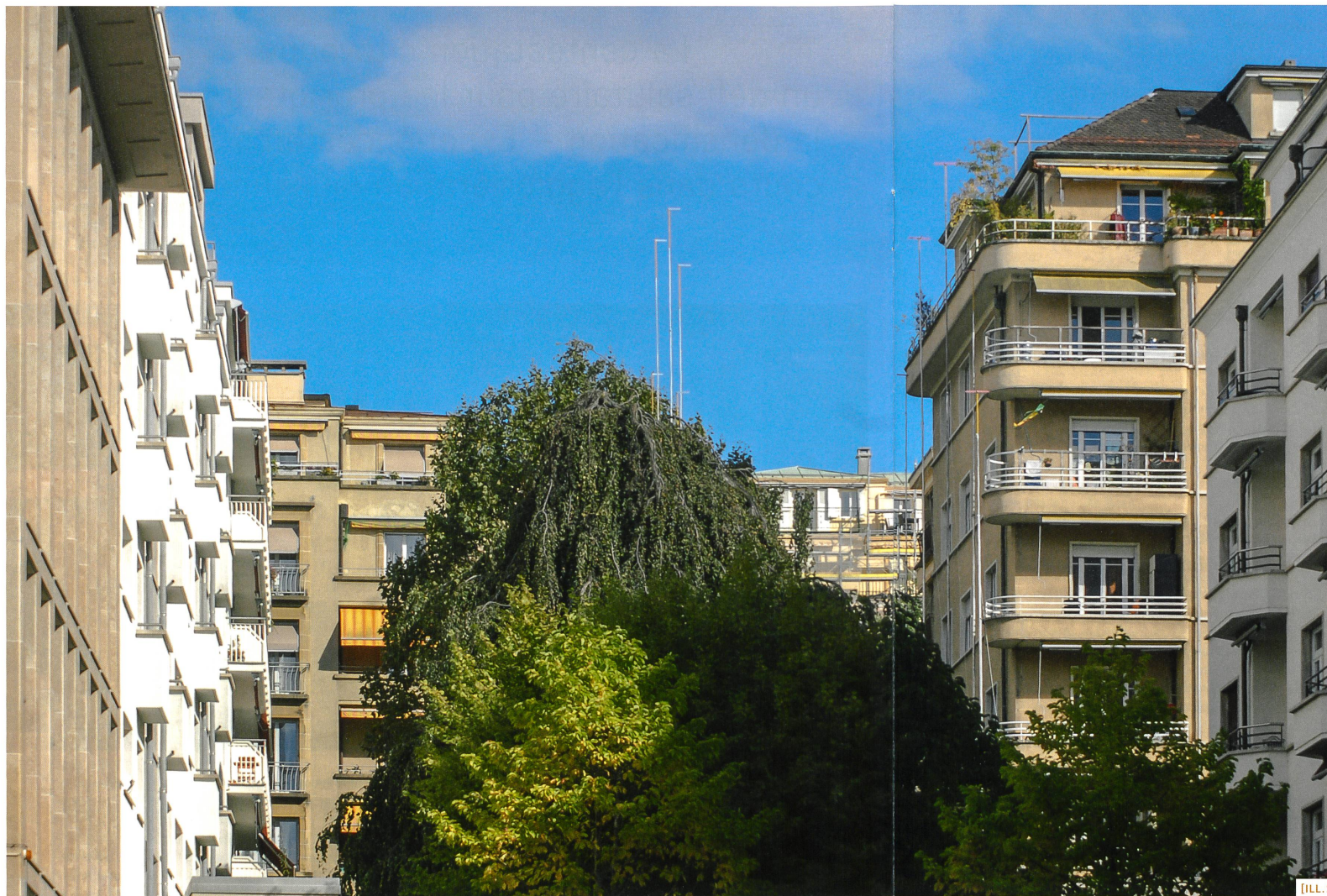
[ILL. 2] Avenue de l'Avant-Poste 13, gabarits de l'agrandissement, (Photo: Urs Zuppinger)