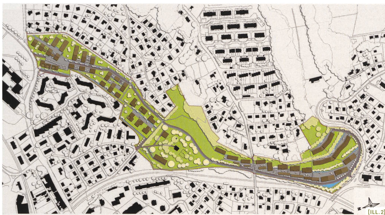
[ILL. 2] Plan de l'avant-projet des équipements Coteau-est (Syndicat Coteau-est); (Hüsler et Associés Sàrl, Lausanne).