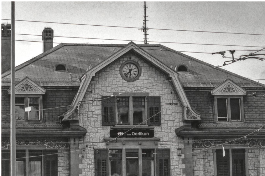
... Orte mit verschiede- nen Gesichtern: oberirdische .../ Des lieux aux multiples visages: en surface ... (Oerlikon)