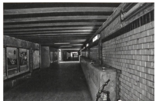
... und unterirdische. .../ ... comme en sous-sol. ... (Oerlikon)