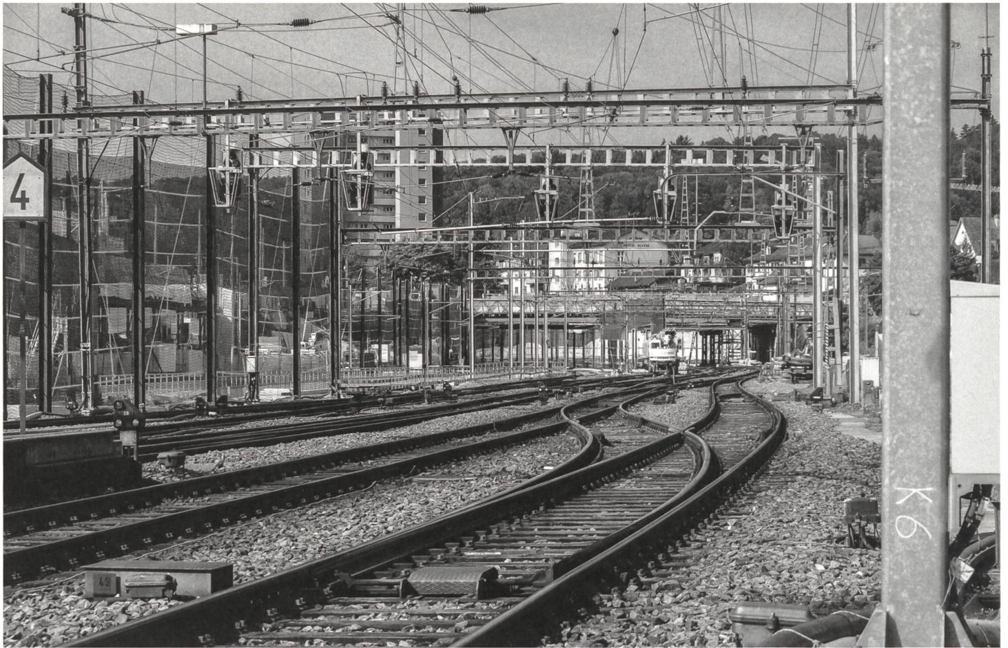
... und zukünftiger Entwicklungen. .../ ... et futurs. ... (Oerlikon)