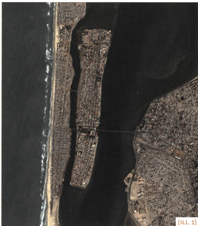
[ILL. 1] Vue aérienne de St-Louis: une orthogonalité remarquable datant des plans d'urbanisme du XVIII e siècle.

Géographe, président de la commission d'urbanisme et d'aménagement du territoire de la Région de Dakar.