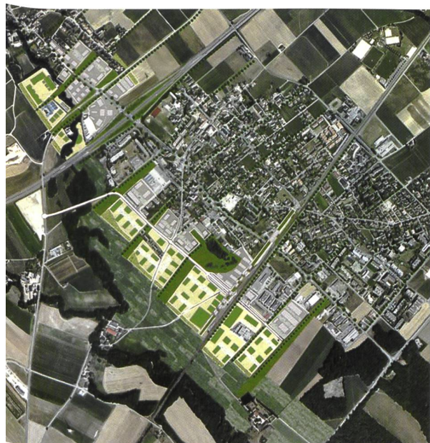
III. 3: Schéma directeur intercommunal Gland-Vich: construction mixte de logements et d'activités.

Pour construire des logements équitablement répartis de part et d'autre de la frontière et accueillir les nouveaux habitants, une première étude a été réalisée pour identifier les leviers facilitant la production de logements durables. Entre 2007 et 2008, au cours d'échanges avec les professionnels du logement aidé et du marché libre des trois entités française, vaudoise et genevoise, cinq catégories de leviers sont proposées en réponse aux blocages identifiés: anticiper la production de foncier, professionnaliser le management de projet, articuler Projet et documents d'aménagement du territoire ou d'urbanisme, décloisonner les cultures et informer et sensibiliser les différents publics. Une seconde étude est en cours afin d'identifier les aspirations résidentielles des habitants.