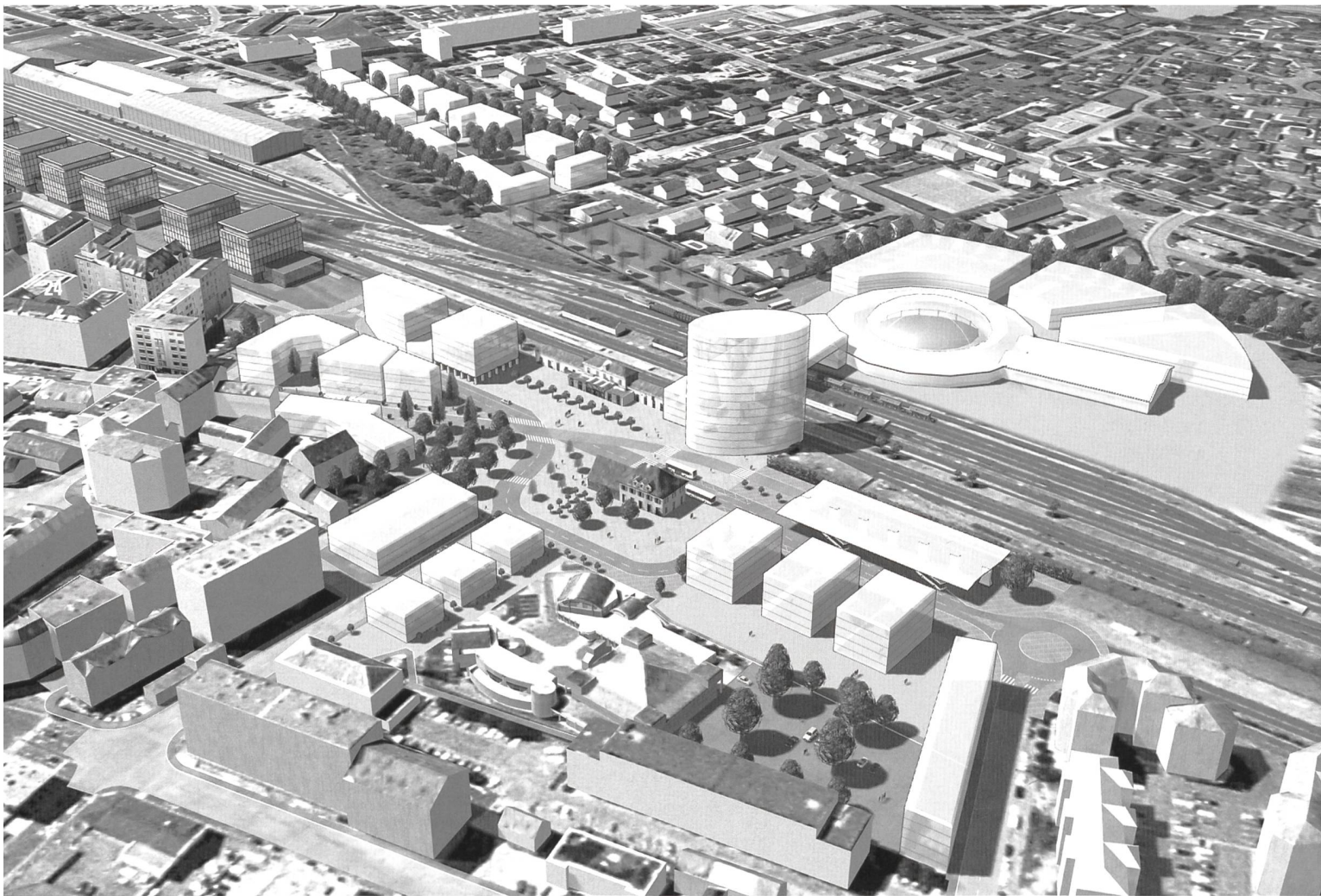
Ill. 2: Projet Etoile Annemasse-Genève: opération de renouvellement urbain autour de la gare SNCF d'Annemasse, futur centre d'accueil d'ONG, pôle d'activités du secteur tertiaire et de logements.

économiques. D'autre part, un territoire français, appelé le Genevois français, dynamisé par sa situation mais marqué par une forte proportion d'emplois dans les services de proximité.