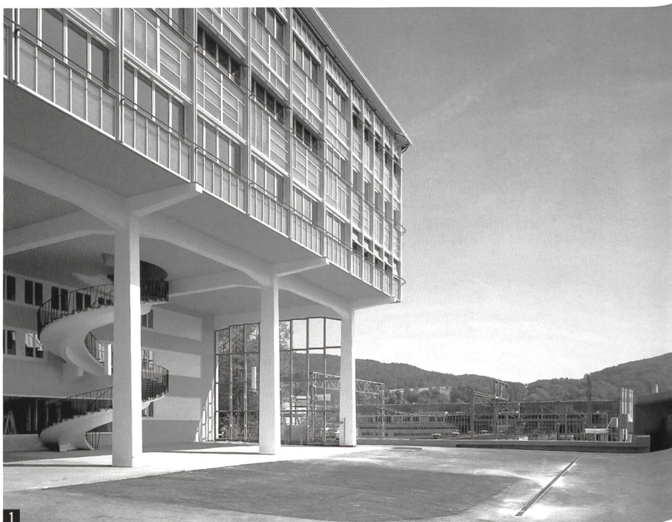
1 Ehemaliges Wohlfahrtsgebäude der BBC, Baden, Armin Meili, 1952-54; Umnutzung und Sanierung, Burkard Meyer Architekten, 2002-06.

Als nächster Schritt wird das Wettbewerbsergebnis vom Projektteam optimiert, begleitet von einem Ausschuss der Jury. Gestützt darauf werden die planungsrechtlichen Instrumente entworfen, der Bevölkerung zur Mitwirkung vorgelegt und nach der Planaufgabe zur Volksabstimmung gebracht. Der Gemeinderat ist zuversichtlich, dass das nun vorliegende