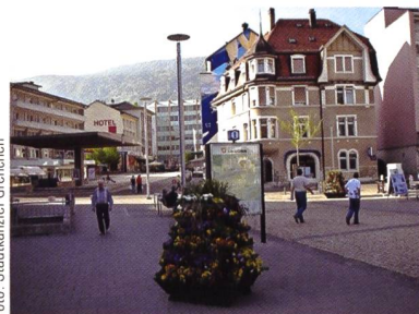
Innenstadt Grenchen

Der Strukturwandel entziehe den Liegenschaftseigentümern die wirtschaftliche Basis. Folgen davon sind mangelnder Unterhalt, Zerfall und Nutzungen, die aus finanziellen Gründen zwar akzeptiert werden, ihrerseits aber dem Image der Altstadt Schaden zufügen. Als Lösungsansätze wurde neben der Stadtanalyse eine «Wohnstrategie» für eine prozesshafte Identifikation und Nutzung der Wohnpotenziale einer Altstadt vorgestellt. Dieses Instrument