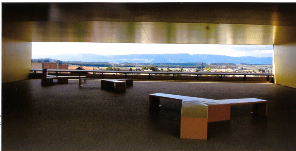
Fig. 4: Vue panoramique sur la plaine d'Estavayer-le- Lac et le Jura au travers du bâtiment.