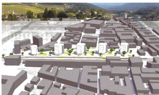
Projet retenu au deuxième tour: «VEVecoVILLE», Bellmann architectes, Plarel architectes urbanistes, Christe et Gygax, Atelier du Paysage J-Y Le Baron, C'S'D