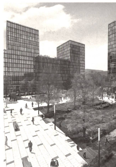
La place centrale

Moser: La préoccupation de qualité se retrouve dans toute la démarche du projet, à commencer par le concours d'idées, puis le mandat d'études parallèles, le Masterplan et finalement les plans de quartier. A chacune de ces échelles, il s'agissait d'être le plus précis et rigoureux possible pour assurer la qualité du projet global. La qualité de l'espace public est un facteur majeur pour la réussite de l'ensemble du projet. De toute façon, on ne peut se passer d'une planification cadre qui définit les règles communes. Mais ce que nous faisons également dans d'autres projets, c'est de définir un projet pour l'espace public avant même de penser aux constructions pour stabiliser certaines intentions initiales. On a constaté que cela fonctionne très bien car on peut fixer des « garde-fous » qui permettent ensuite de laisser certaines libertés aux architectes qui ont chacun leur propre projet. Par notre expérience d'amener les voyageurs à la gare et de les faire ressortir, nous disposons d'une sensibilité très poussée en ce qui concerne l'organisation et l'attractivité de l'espace public, de sa