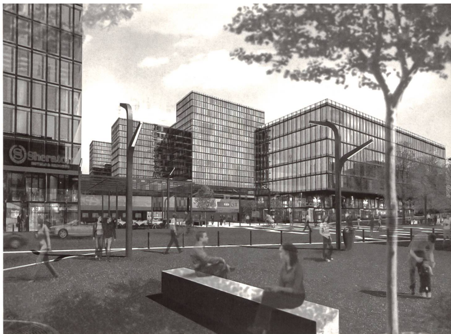
La place de la gare

Cornut: Déjà dans des expériences antérieures nous avons surtout travaillé sur la question de l'intérêt propre de l'Etat dans ce type de développement, principalement le pilotage et la coordination. Dans ce sens il y a deux éléments fondamentaux : les équipements et les espaces publics. Sur ces thèmes, les CFF et l'Etat sont tombés d'accord dès le départ du projet. Il s'agit donc de maîtriser ces éléments en développant