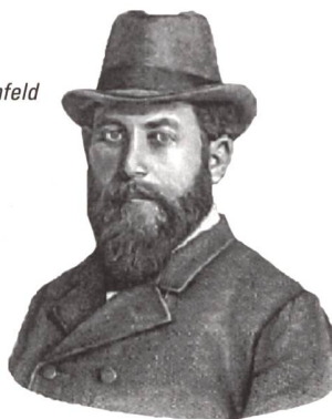
Portrait Xaver Imfeld

Kartograf und Planer von Bergbahnen. 1876 bis 1890 war er beim Eidgenössischen Topographischen Bureau (heute Bundesamt für Landestopografie swisstopo) tätig. Mehr als zwanzig Blätter des Siegfriedatlas stammen von ihm. Er zeichnete über vierzig Gebirgs-panoramen und modellierte dreizehn Alpenreliefs (u.a. Matterhorn und Jungfrau Gruppe). Er war zuständig für zahlreiche Bergbahn-Projekte (1887 Visp-Zermatt-Bahn, 1890 Gornegratbahn, 1896 Jungfraubahn, 1904 Brig-Gletsch-Bahn). Im Jahre 1901 wurde Xaver Imfeld Ehrenmitglied des SAC.