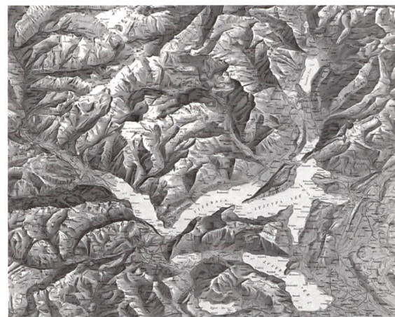
Reliefkarte Zentralschweiz (Ausschnitt)

Herausgeber: IG Xaver Imfeld c/o Historisches Museum Obwalden Brünigstrasse 127, Postfach 1314, 6061 Sarnen Umfang: 200 Seiten, 4-farbig, Fadenheftung Preis: CHF 78.00 ISBN-13: 978-3-9522809-4-2 Weitere Informationen zu Buch und Ausstellungen: info@xaverimfeld.ch , www.xaverimfeld.ch