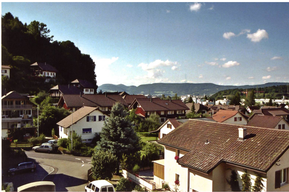
Agglomeration im Mittelland.

Auskunft und Anmeldeadresse: Praktischer Umweltschutz Schweiz Pusch Postfach 211, 8024 Zürich Tel. 044 267 44 11, Fax 044 267 44 14 mail@umweltschutz.ch www.umweltschutz.ch/agenda